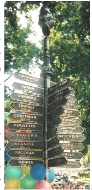
Памятный знак городов-побратимов Одессы

★ Каждый год с 2003 года в Одессе проходит фестиваль „Французская весна“ , предоставляющий горожанам уникальную возможность познакомиться с классическим и современным искусством Франции.