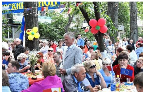
Праздник соседства в Киевском районе, 2009 г.

Во дворах, в скверах, в частном секторе властью совместно с общественными объединениями устраиваются застолья под открытым небом. Жители с удовольствием в них участвуют, как и в творческих выступлениях, концертах, играх и соревнованиях между соседями тему «лучшее блюдо». Участниками праздника ежегодно становится более тысячи человек.